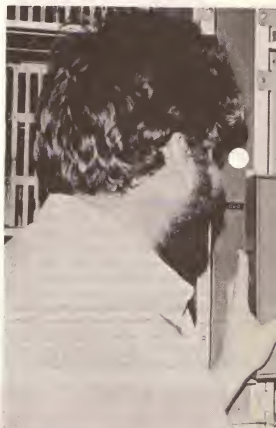
Un di e aparatonan nobo cu ta worde instala door di Philips na Aruba. E aparato di computador cu ta indica ora tin un defecto...

6. Dreimention abrevia. Hopi yamadanan internacional ta consisti di un serie di 10 pa 12 cifranan cu